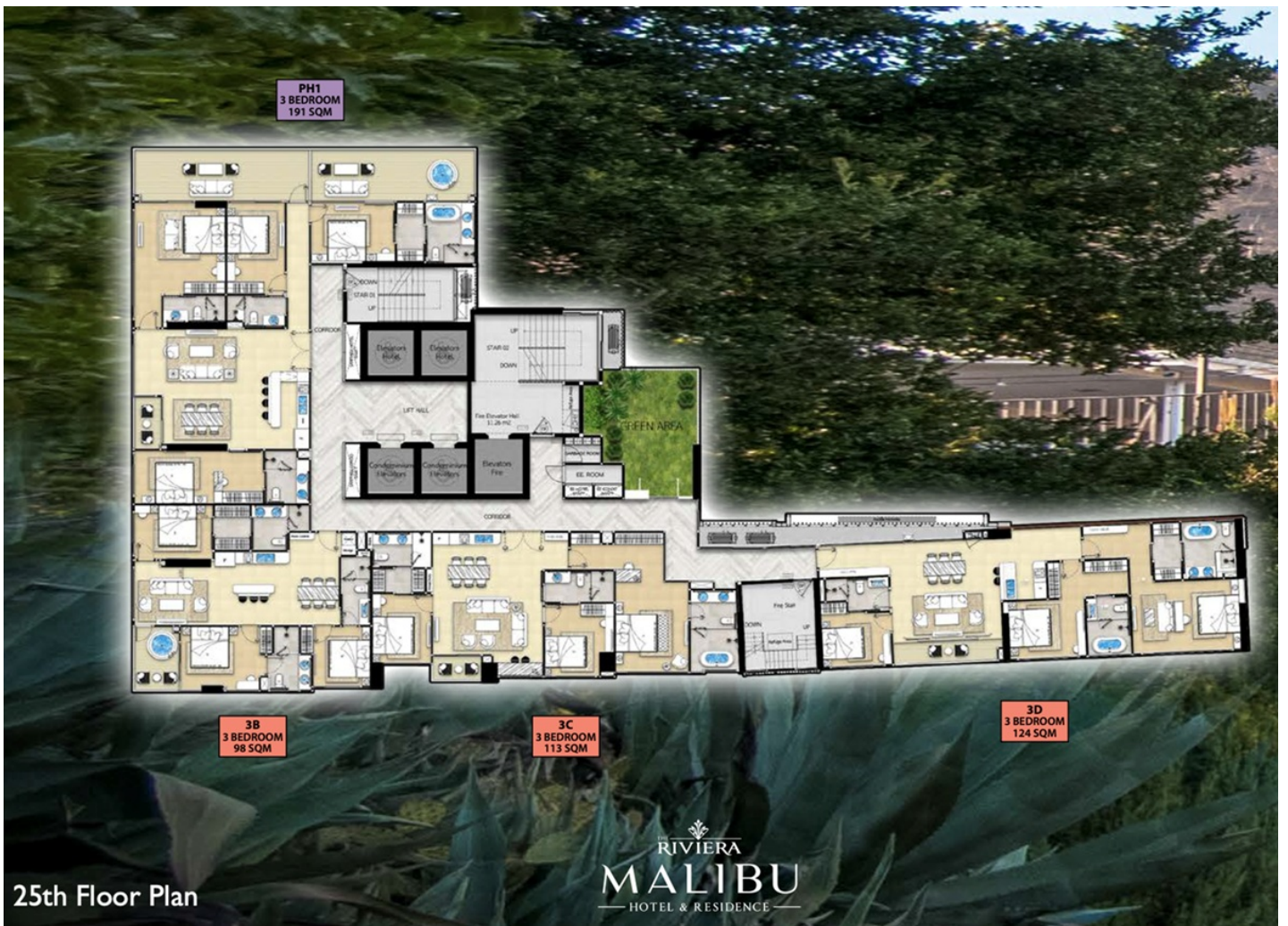
25th Floor Plan