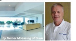
by Heiner Moessing of Siam